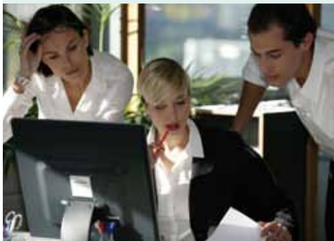
Audit, analyse process et technologie

Nous sommes force de proposition et vous accompagnons dans vos grands projets. Sur la base du bilan de l'existant, nous vous suggérons les meilleurs choix en intégrant les technologies et organisations adaptées répondant à vos attentes et à celles de vos propres clients.