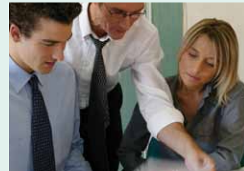
Conseil en innovation