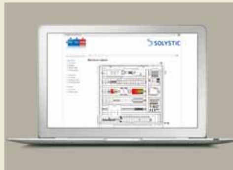
Supervision – easy-View