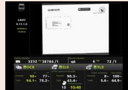
Identification et codage