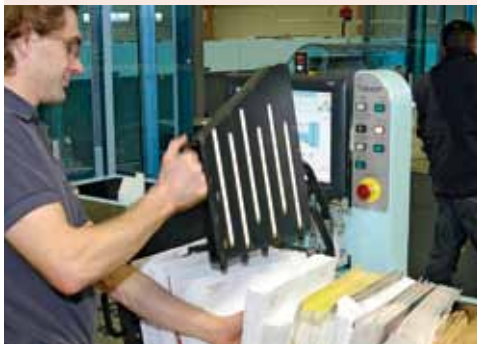
Solution de tri

Pour implémenter vos nouveaux projets, nous pouvons vous proposer des solutions de financement et de partenariat.