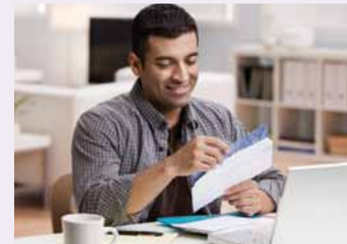
Communication multicanal – MailEbox