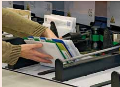
Mise en séquences