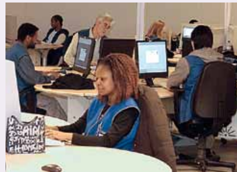
Externalisation des process – Vidéocodage